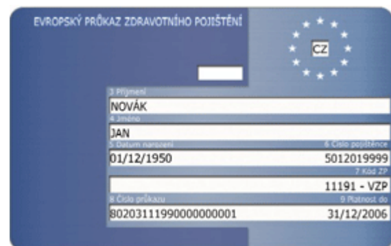
Die Europäische Krankenversicherungskarte (EHIC)