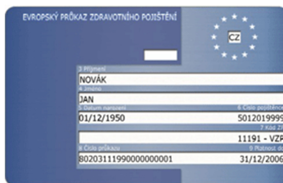
Evropský průkaz zdravotního pojištění (EHIC)

Dokladem toho, že v Německu máte nárok na lékařsky nezbytnou péči, je Evropský průkaz zdravotního pojištění (EHIC), který zavedly Spolková republika Německo a Česká republika 1.6., resp. 1.7.2004. Průkaz, který je vystavován v místních pobočkách zdravotních pojišťoven, opravňuje majitele během jeho pobytu v sousední zemi k volnému přístupu k lékaři. EHIC však neosvobozuje majitele od případných doplatků.